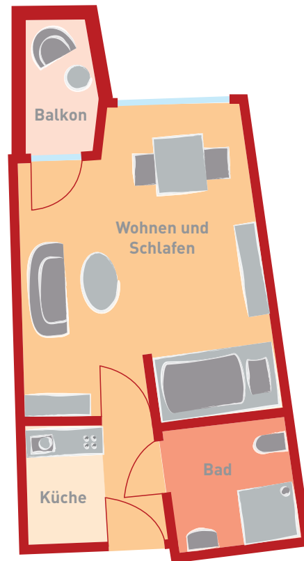
Einraum-Appartement ca. 33 qm